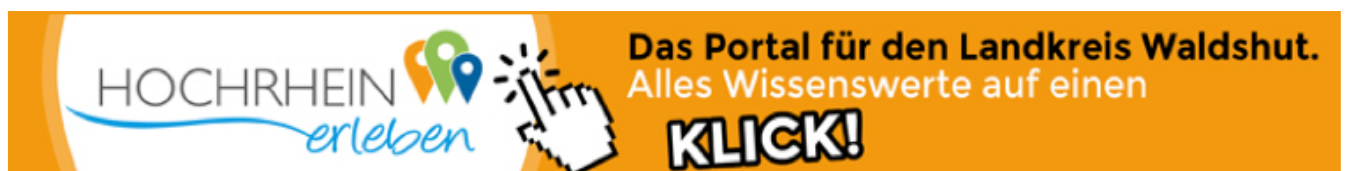
Beispiel für Banner 2 | Leaderboard

Beispiele für Bannerwerbungen finden Sie auch auf unserer Internetseite unter Werben bei uns!