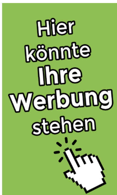
Beispiel für Banner 1 | Vertical Rectangle

Beispiele für Bannerwerbungen finden Sie auch auf unserer Internetseite unter Werben bei uns!